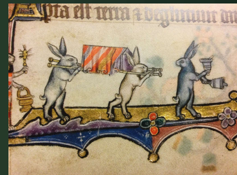
(マックズフィールド詩編) 14世紀末