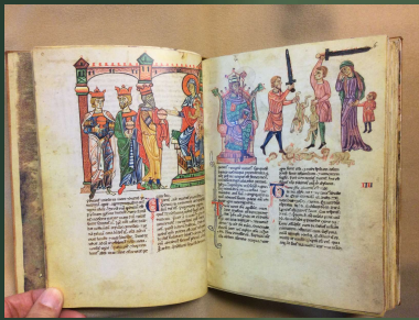
(新約聖書) 13世紀前半?