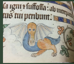
(ラットレル詩編) 1325-40年