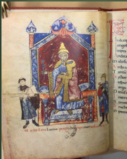
(カッサのマルダ 伝) 1115年