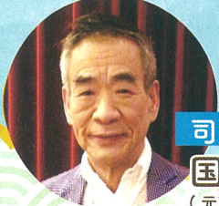
司会 国井 雅比古 (元NHKエグゼクティブアナウンサー)