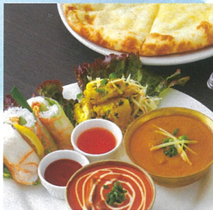
アジアンランチ ¥1,350 B館9F/スバカマナ