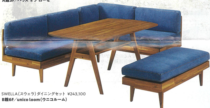
SWELLA(スウェラ) ダイニングセット ¥243,100 B館6F/unico loom(ウニコルーム)