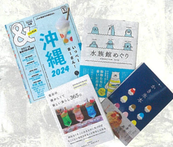
東京の懐かしくて新しい暮らし365日 ¥1,700 & TRAVEL沖縄2024「ハンディ版」 ¥1,100 水族館めぐり ¥1,848 かき氷本 ¥1,430 A館6F/MARUZEN

涼しく快適に過ごすためのグッズや アウトドアで大活躍の便利アイテムまで 夏の新作雑貨大集合♪