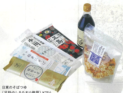
日東のそばつゆ (足助のしろたまり使用) ¥754 長崎五島手延べうどん ¥538 小川の手延べ稲庭うどん ¥646 北海道オホーツク産そば ¥538 信州軽井沢そば ¥646 国産えび&イカリ入り本気の天かす ¥484 B館6F/こととや