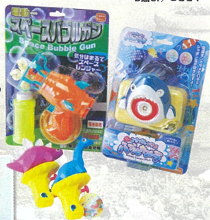
電動スペースバブルガン ¥980 ルンリンごきげんなサメバブルカメラ ¥1,870 恐竜ウォーターガン各種 各¥418 B館5F/ヴィレッジヴァンガード