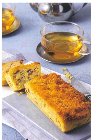
クリームチーズをたっぷり使ったしっとり 濃厚なチーズケーキがほろほろした生地に よく合います。レーズン入り。