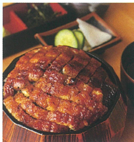
ひつまぶし並 ¥2,580 B館8F/名古屋めし食堂