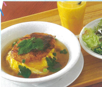
とろとろ玉子のあんかけオムカツ 単品 ¥1,309 サラダドリンクセット ¥1,639 B館8F/ことと屋