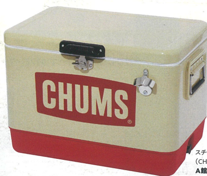
スチールクーラーボックス (CHUMS) ¥29,480 A館8F/ラフティングカンパニー