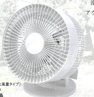
サーキュレーター (低騒音ファン・大風量タイプ) ホワイト ¥6,990 B館4F/無印良品