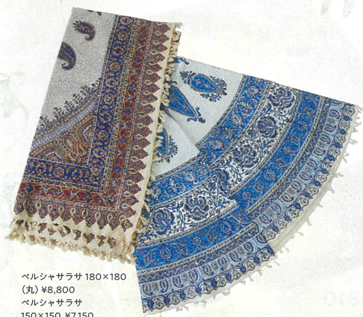
ベルシャサラサ 180×180 (丸) ¥8,800 ベルシャサラサ 150×150 ¥7,150 A館7F/アミール