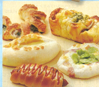
調理パン各種 ¥259~ A館1F/ドック

※写真はイメージです。※毎日限定個数の商品もございます。※掲載金額はすべて税別表示です。