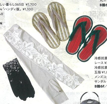
冷感抗菌ボタニカル レース ¥2,200 冷感抗菌しゅう 五指 ¥1,870 メンズコットン サンダル 各¥880 B館6F/アレックスコンフォート