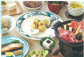
夏の特別ランチ ¥3,500 ※6/1~8/31 B館9F/梅の花