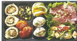
玄米ロール入り 30品目の Sarad bento ¥1,239 ※各日ご用意数に限り がございます。 A館1F/グリーン・グルメ