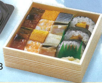
大阪寿司 ¥843 A館1F/古市庵