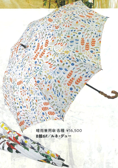
晴雨兼用傘 各種 ¥16,500 B館6F/ルネ・デュー