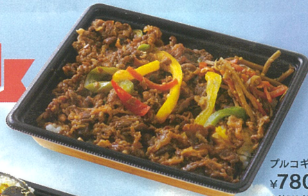
ブルコギ弁当 ¥780 A館1F/お肉の専門店スギモト