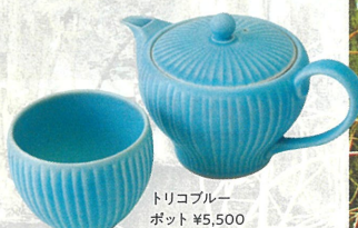
トリコブルー ポット ¥5,500 丸カップ ¥1,760 B館6F/私の部屋