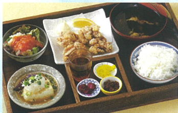
唐揚げ定食 ¥1,518 B館8F/ツクモ食堂