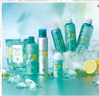
ミントリープ ・クールボディシート 20枚 ¥660 ・クールボディスプレー 100g ¥1,430 ・クールボディソープ 300ml ¥1,430 ・クールUVジェル 40ml ¥1,650 ・クールシャンブーン 250ml ¥1,650 ・クールカルプスプレー 100g ¥1,650 ・クールボディローション 200ml ¥1,650 A館3F/ハウス オブ ローゼ