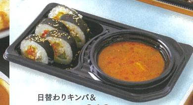
日替わりキンパ& スープ弁当 ¥810 A館1F/カルフア