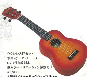
ウクレレ入門セット 本体・ケース・チューナー・ DVD付き教則本 ※カラーバリエーション多数あり ¥3,980 A館8F/ミュージックショップリバー