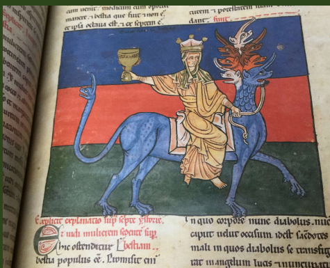
(マンチエスタ写本 f. 86)

2025年2月1日(土)~2月26日(水) 10:00~20:00 (図書館開館日)