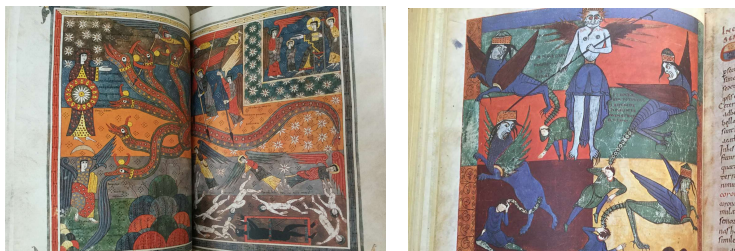
(シロス写本 f. 147v-148)

ファクシミリ本 ・ ・ オリジナル写本の大きさ・色をそのまま再現したもので、中には羊皮紙のシワや汚れ・破れ・落書きなどもそのまま再現したのもあり、中世の雰囲気を手にとって味わえます。