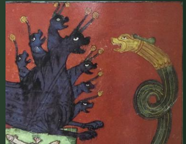
(14世紀前半 ラットレル詩編)