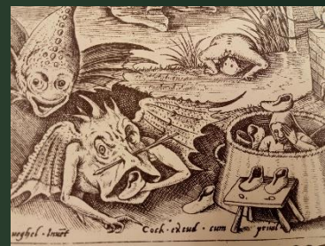
(聖アントニウスの誘惑) 1556年