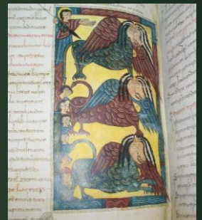
(10世紀末 エスコリアル写本)