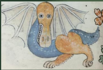
(14世紀前半 ラットレル詩編)