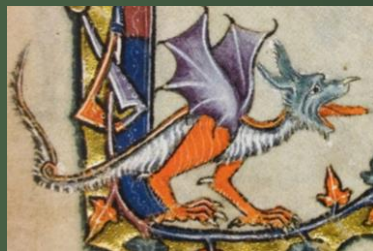
(14世紀前半 マックスフィールド詩編)