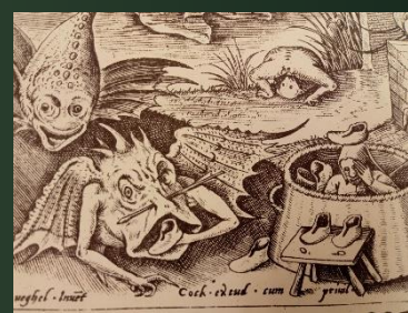
(嫉妬：七つの大罪 シリーズ) 1558年