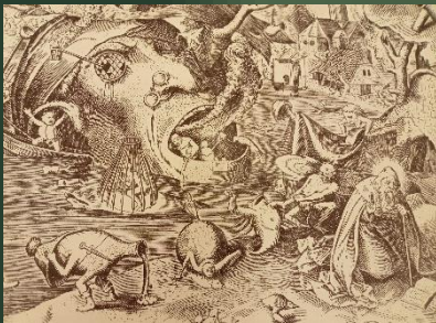
(聖アントニウスの誘惑) 1556年