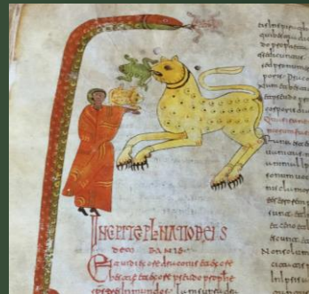
(10世紀半ば マドリッド写本)